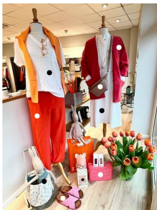
Alberte & Albertine

Zur Belebung und Unterstützung der lokalen Ökonomie wird das digitale Projekt des Hamburger Startups ViWQ „Visual Window QR“ im Rahmen des FLEKS-Projekts unterstützt. So können die Besucher:innen einen QR-Code an dem Schaufenster der teilnehmenden Geschäfte scannen, um auch außerhalb der Öffnungszeiten weiter auf dem Handy bequem einkaufen zu können. Für die Teilnahme am Digitalen Schaufenster entstehen für ein halbes Jahr Kosten in Höhe von 120,00 €. Dank Fördergeldern der Städtebauförderung fallen für das Unternehmen lediglich 60,00 € an. Für alle Unternehmen: Kommen Sie gerne auf uns zu. Wir senden Ihnen gerne in visueller Form die Ideen sowie Informationen zum Einrichten des jeweiligen Accounts zu.